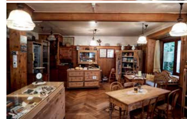
Die hausgemachten Capuns und weitere regionale Köstlichkeiten können im hauseigenen Laden gekauft werden.

50 Kilo Capuns-Teig setzt Andreetta Schwarz jeweils am Sonntagabend an. Genug, um in der Woche darauf 1000 Portionen davon in Mangoldblätter zu wickeln, exakt nach dem Capuns-Rezept, das sie von ihrer Grossmutter übernommen hat. Produziert wird in der Küche der Alten Post in Zillis weit mehr, als die Gäste verzehren. Voll wird das Haus vor allem im Sommer, wenn die Wanderer und Touristen die für ihre einzigartige Bilderdecke bekannte romanische Kirche von Zillis besuchen. Im Winter finden nur einzelne Stammgäste und Dorfbewohner den Weg in die Alte Post. Die meisten Wintertouristen buchen ihre Zimmer im Skort Splügen oder im benachbarten Andeer mit seinem Mineralbad. Um die ruhige Zeit zu überbrücken, hat die Wirtin sich und ihren Betrieb neu erfinden müssen. Ihre Gaststube hat sie zur Hälfte in einen Laden mit regionalen Spezialitäten umgewandelt, in der Küche die Produktion von Capuns und Nusstorte ausgebaut. Die Nusstorten und die traditionellen Bündner Mangoldwickel verschickt sie in die ganze Schweiz, die Capuns auch in einer vegetarischen Variante. «Allein vom Gasthaus könnte man hier nicht mehr leben, die Produktion und der Versand von eigen-